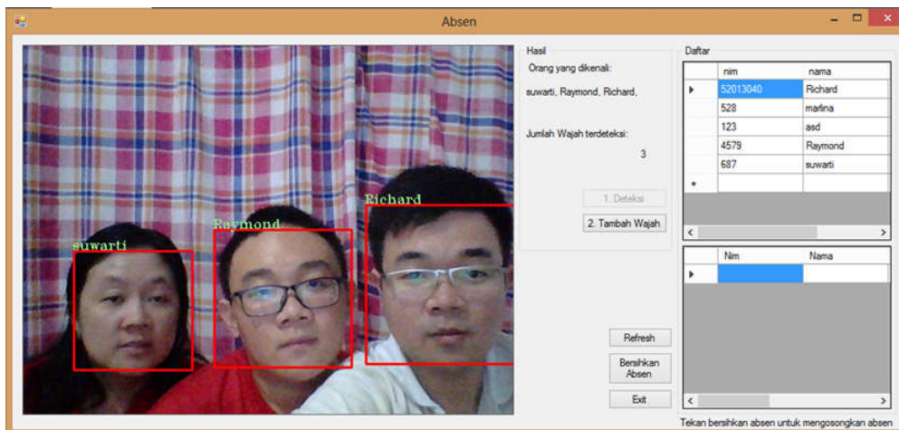
Gambar 4. Tes 3 Wajah