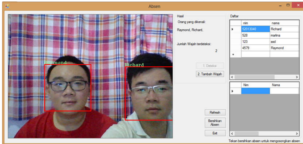
Gambar 3. Tes 2 Wajah