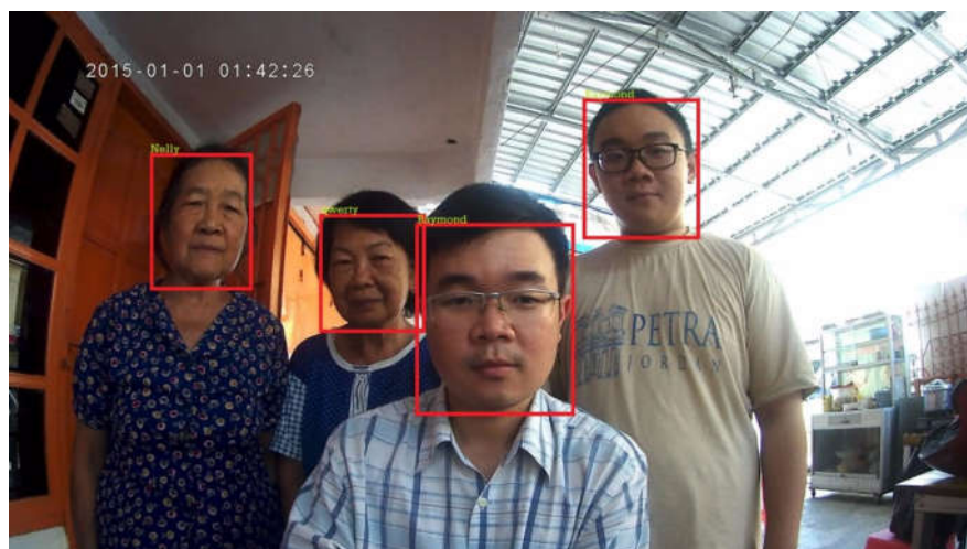
Gambar 5. Tes 4 Wajah